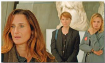
festival Venise 2024, sélection officielle