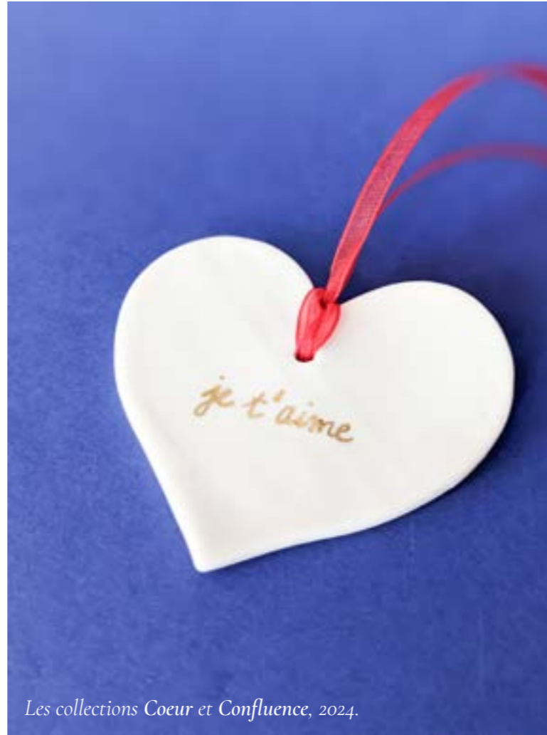
Les collections Coeur et Confluence, 2024.