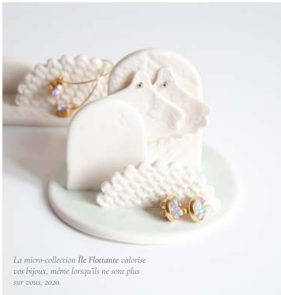
La micro-collection Île Flottante valorise vos bijoux, même lorsqu'ils ne sont plus sur vous, 2020.

L'Atelier des Curiosités est un studio de céramique fondé en 2015 par Armelle et Charly. Au sein de cet espace de création spécialisé dans la porcelaine, les créatifs proposent des objets sensibles et poétiques sur le principe de la série différenciée. Assiettes, tasses, luminaires, vases, broches ou fèves, les créateurs aiment interroger le vaste champ du design d'objet pour y ajouter leur touche de magie.