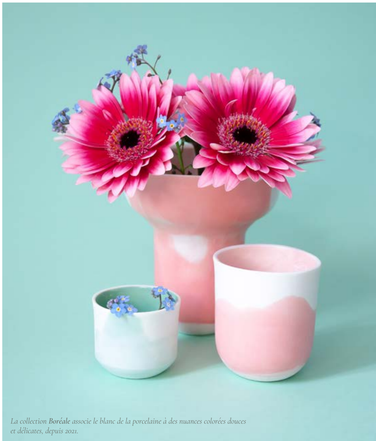
La collection Boréale associe le blanc de la porcelaine à des nuances colorées douces et délicates, depuis 2021.