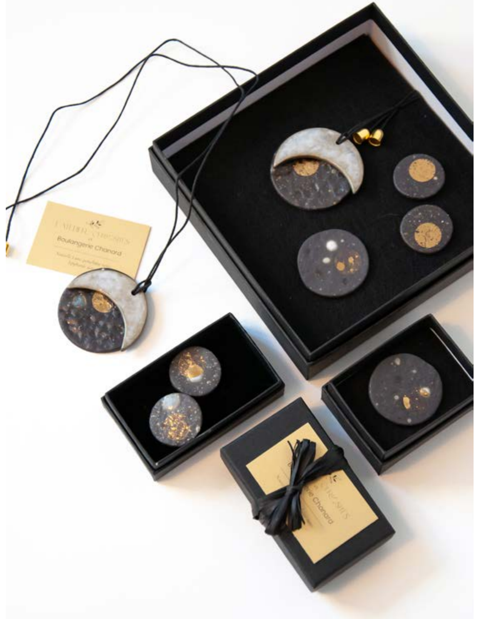
Ensemble de fèves Nouvelle Lune réalisé pour la Boulangerie Chanard lors de l'épiphanie 2022.