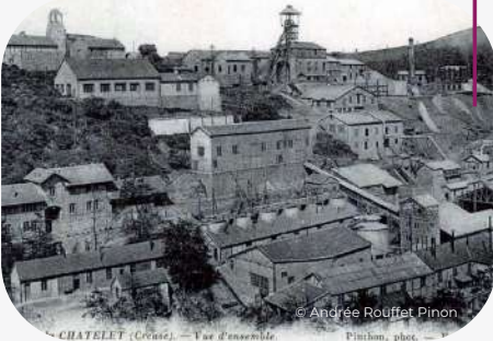
CHATELET (Creuse). - Vue d'ensemble.

Derrière l'accès interdit, se trouvait la chambre chaude, là où les mineurs se changeaient et sur le flan de la colline toute l'usine avec les galeries de la mine d'or.